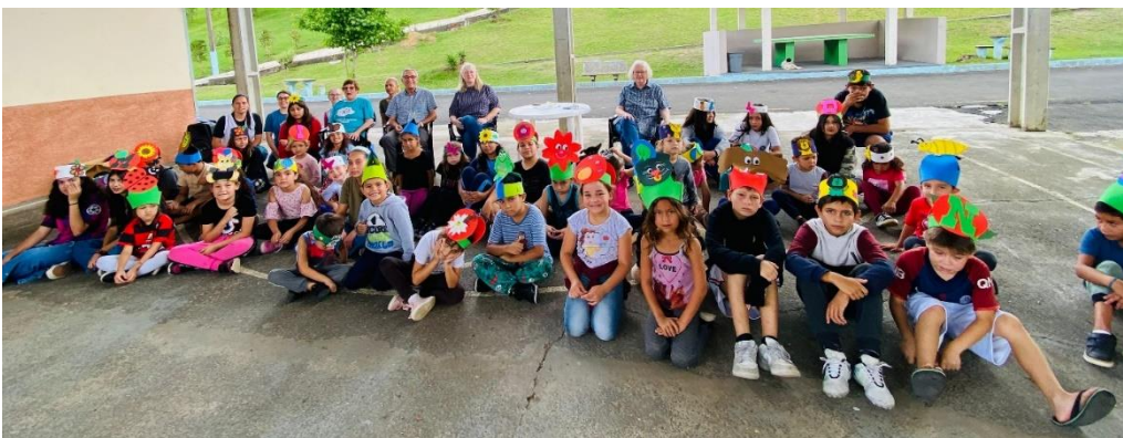
Kinder des Kinderdorfs; im Hintergrund ein Teil der Betreuer und Besucher vom Förderverein aus Deutschland, Nov. 2024

Der Erlös des Basars ist wiederum für das Kinderdorf Irati in Brasilien bestimmt. Das Partnerschaftsprojekt unserer Gemeinde besteht nun schon über 32 Jahre. Heute leben im Kinderdorf etwa 50 Kinder bei Pflegeeltern. 140 Kinder, die auch aus der benachbarten Armensiedlung kommen, nehmen an der Tagesbetreuung teil. Es gibt unterschiedliche Angebote: Musik, Yoga, Spiritualität, Sport, Ballett, Lesen, Förderunterricht. Hinzu kommen Sonderprogramme, wie z. B zur Umweltbildung, zur Gesundheitsvorsorge oder zum Schutz vor Missbrauch. Nach Beendigung der Schulzeit werden die jungen Menschen in eine berufliche Ausbildung vermittelt.