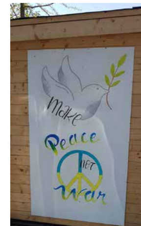
♥ Jugendtreff Hillerheide, Heidestraße 25