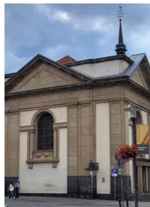
♥ Gymnasialkirche, Steinstraße 2